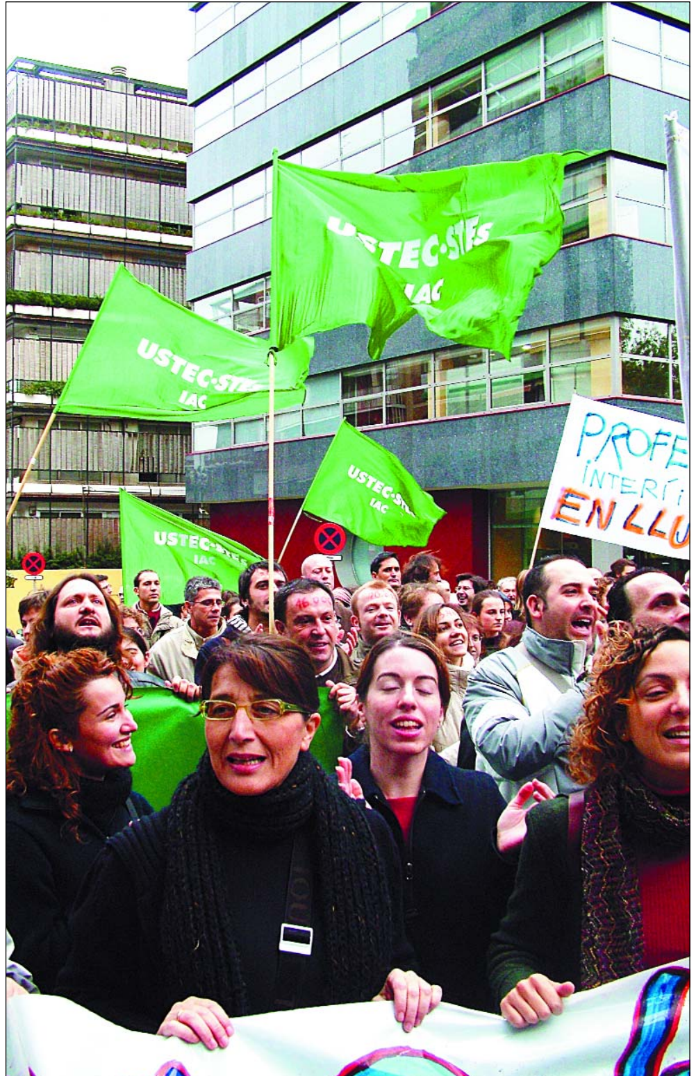
Concentració davant el Departament d'Educació, durant la jornada de vaga

ral del professorat interí/substituit i el contingut d'aquest Acord. Finalment, demanem al Departament d'Educació i a les organitzacions sindicals signants que reflexionin sobre l'acte poc democràtic que duran a terme en excloure USTEC·STEs de la comissió de seguiment d'aquest acord pel fet de no signar-lo.